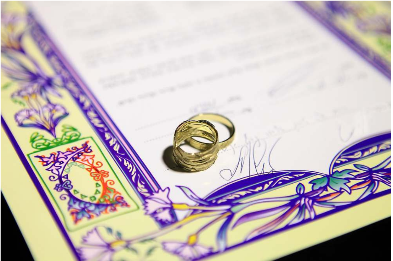
Ketubah – marriage contract in jewish religious tradition

Как известно, вследствие инициативы дочерей Цлофхада (о которой рассказывается в книге Бемидбар) Всевышний запретил девушке, наследующей состояние отца, выходить замуж за сына иного колена Израиля – чтобы земельное владение не переходило от колена к колону.